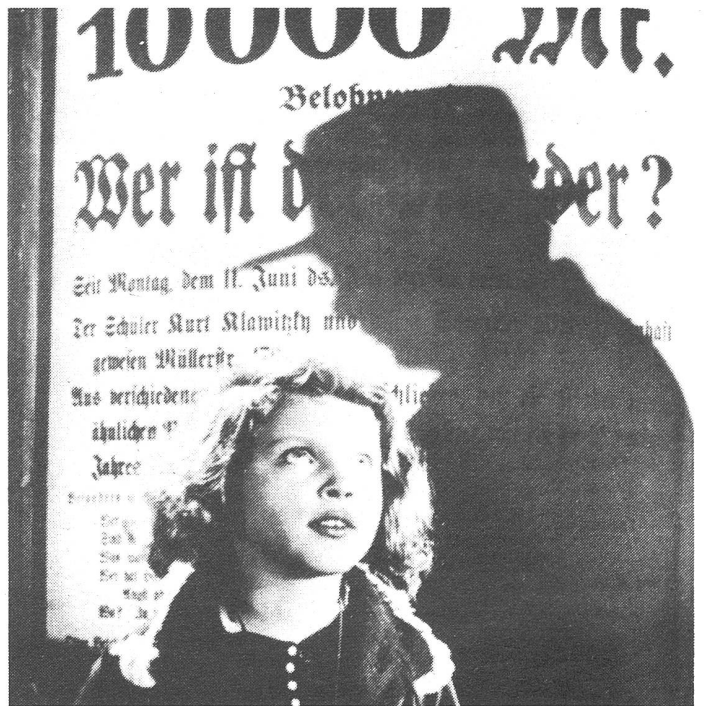
Mysteriöses Verschwinden von Kindern: M – eine Stadt sucht einen Mörder .