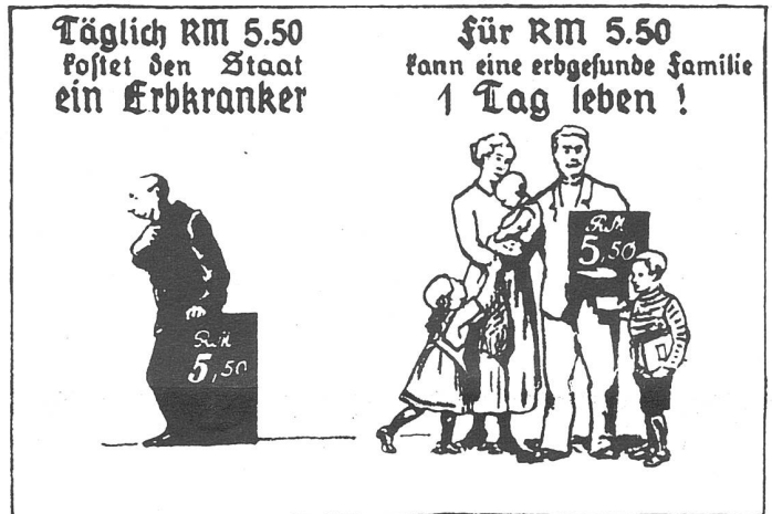
Nazi-Propaganda gegen Erbkrankte Wird die „Pfleger der Erbgesundheit“ fortgesetzt?

Die Angebote der neuen Reproduktionstechnologien suggerieren den Frauen, dass sie nun frei entscheiden können, das heisst, dass sie über ihren Körper selbst bestimmen können. Wir müssen aber erkennen, dass die Frauen weltweit zu einer unterdrückten Gruppe gehören, dass sie also «fremdbestimmt» sind. Solange aber Frauen nicht selber entscheiden können, ob und wieviele Kinder sie haben wollen, solange sie als Frauen der Ersten und Dritten Welt, als nichtbehinderte und behinderte Frauen, als weisse und farbige Frauen verschieden bewertet werden, solange ist es pervertiert, von der Freiheit zur Selbstbestimmung über den eigenen Körper mittels der Reproduktionstechnologie zu reden.