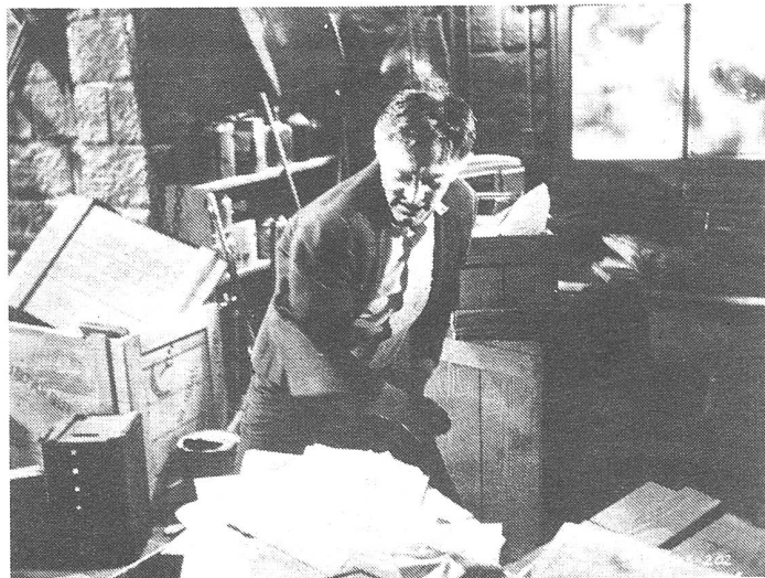
Zerstörung einer heulerischen Vergangenheit: Kirk Douglas in « The Arrangement ».