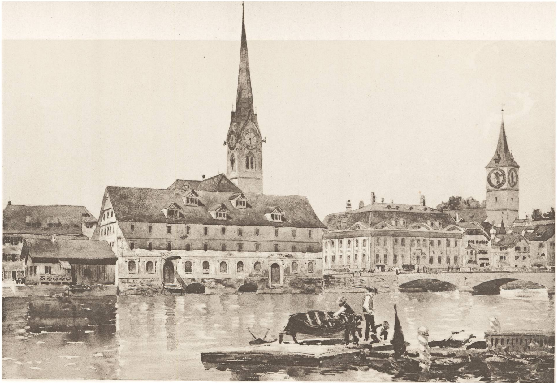
NACH EINEM AQUARELL VON W. LEHMANN.