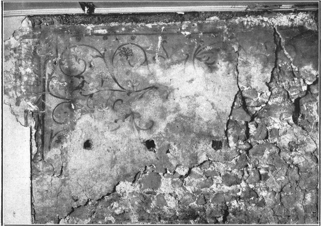
Wandmalereien im Sigriftenhaus St. Peter.