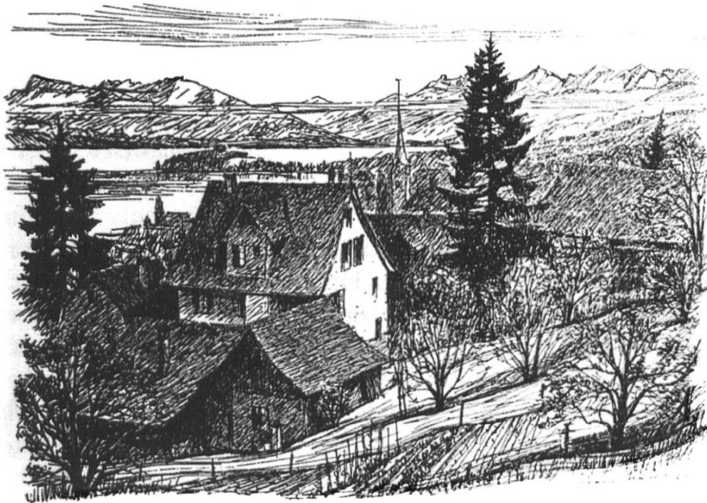
Abb. 1: Weinbauernhaus Biber, Postkarte. Federzeichnung H. Matthys. (Ortsbildarchiv Horgen.)

Der Biber'sche Hof lag in jenem Dorfteil Horgens, der den Flurnamen «Stocker» trägt. Er war stattlich, und das dazugehörige Weinbauerngut hatte gemäss der Hofbeschreibung von 1871 einen beachtlichen Umfang. 4 Das Grundstück lag auf dem Gebiet der heutigen Einsiedler-/Stockerstrasse und reichte in Seerichtung bis zum einstigen Krankenasyll, dem heutigen Spital Zimmerberg, und auf der anderen Seite bis hinauf zum Waldrand des Horgenbergs. Bibers Vater Heinrich hatte zwei Wohnhäuser, mehrere Wirtschaftsgebäude und ein Grundstück übernommen, zu dem nebst Weideland, Wald und Ried (Rodungsgebiet) gut hundert Aren Rebland gehörten, was fünfmal